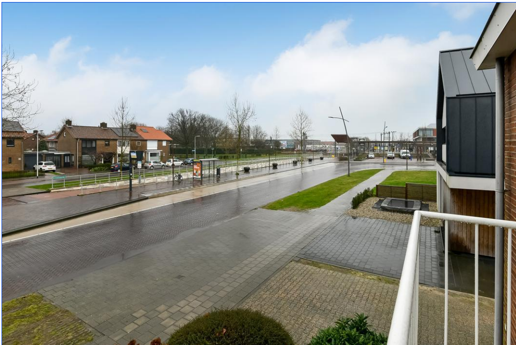
Van Oldenbarneveltstraat 20, 6662 AT Elst