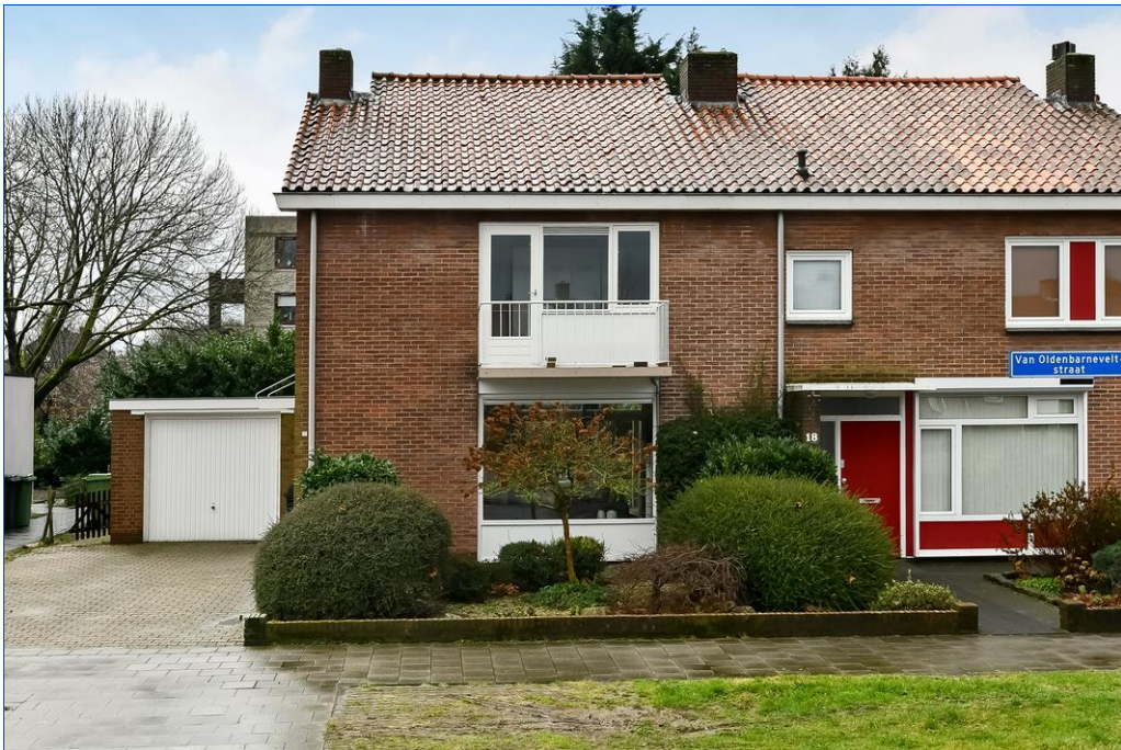
Van Oldenbarneveltstraat 20, 6662 AT Elst