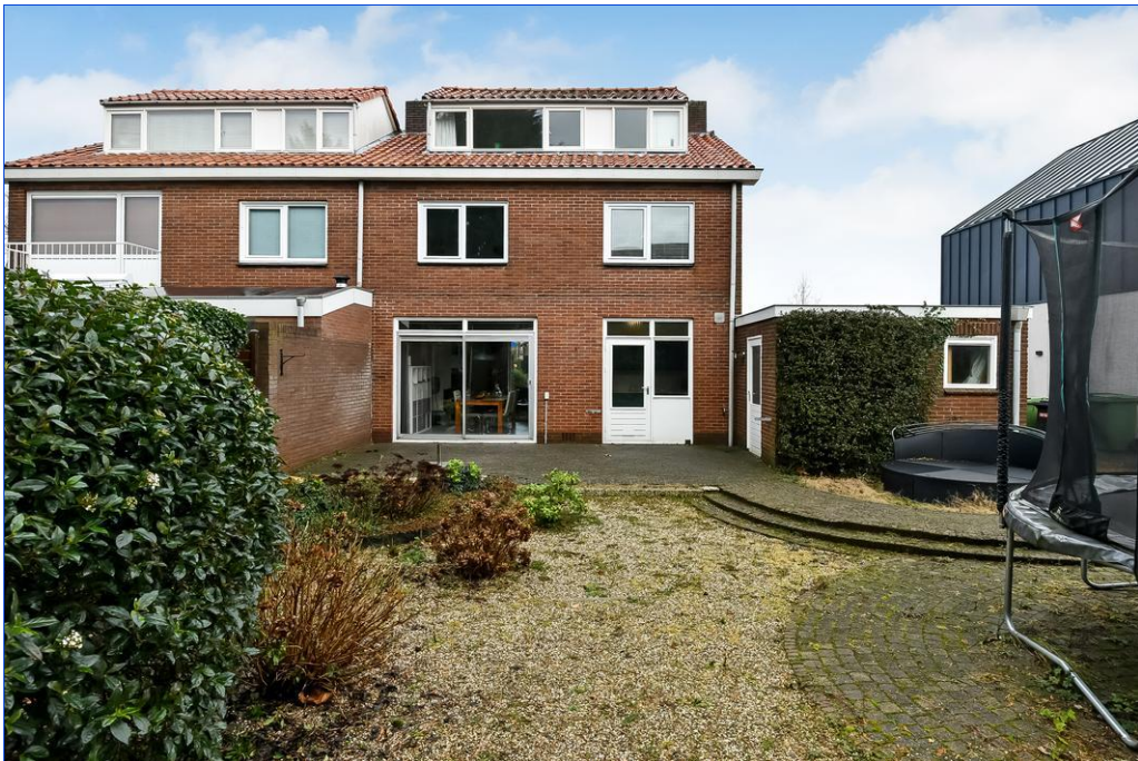
Van Oldenbarneveltstraat 20, 6662 AT Elst