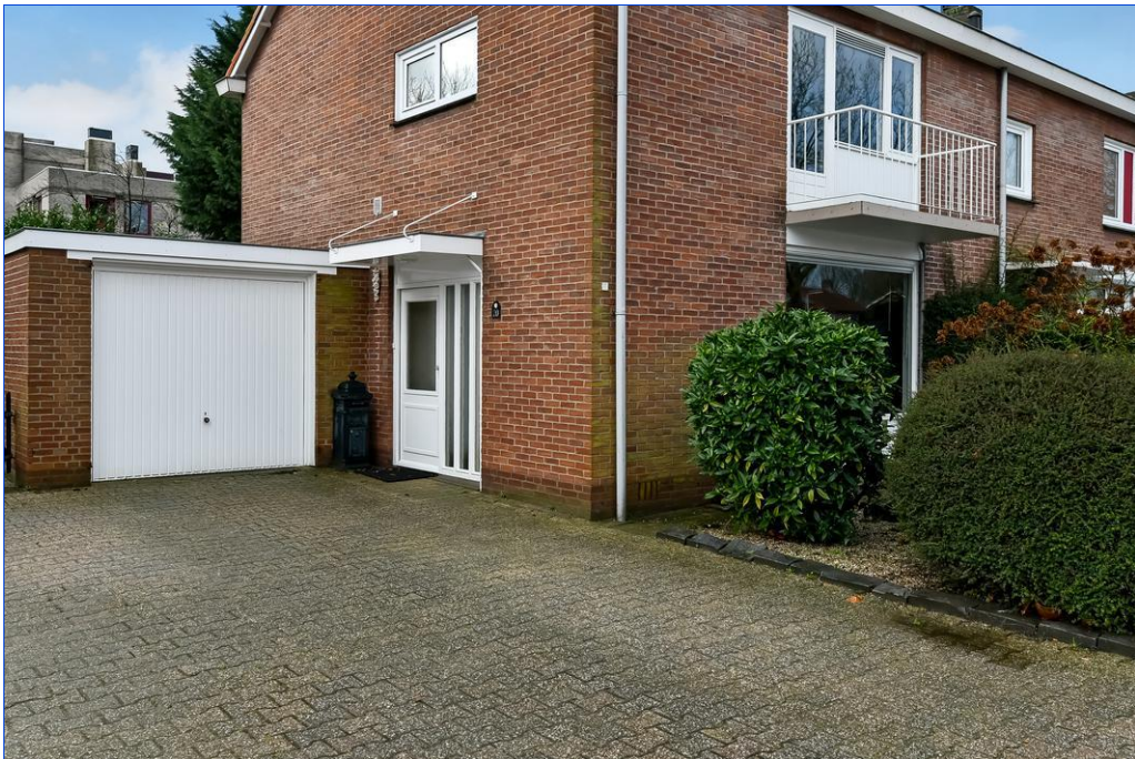
Van Oldenbarneveltstraat 20, 6662 AT Elst