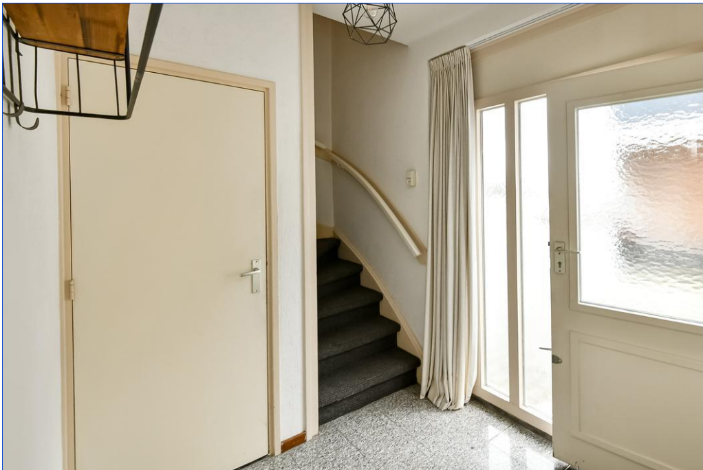
Van Oldenbarneveltstraat 20, 6662 AT Elst